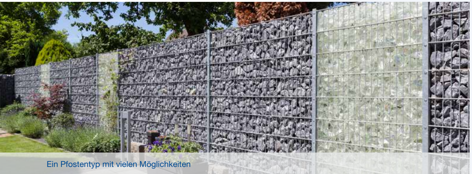
Ein Pfostentyp mit vielen Möglichkeiten