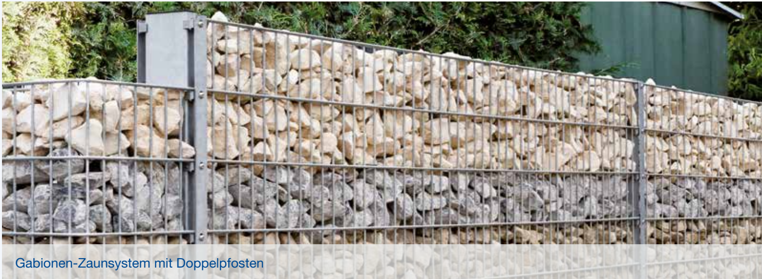
Gabionen-Zaunsystem mit Doppelpfosten