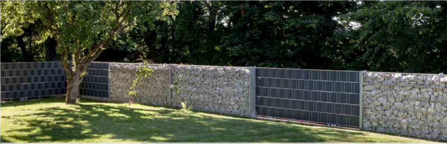
Doppelposten in perfekter Kombination mit Sicht- und Windschutz.